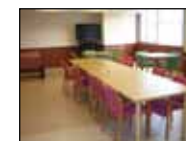
2階デイサービスのリビング