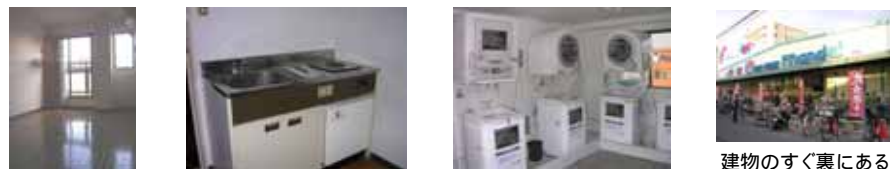
建物のすぐ裏にあるスーパーです。

【おすすめポイント】 駅から徒歩5分！地下鉄長居方面行きのバス停まで徒歩2分！スーパーや100円ショップまで徒歩2分と便利な場所です！ 24時間対応可能なヘルパーステーションが1階にあります！ 福祉・生活保護の方、外国籍の方も入居相談できます！