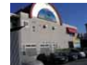
提携先の デイサービスセンター